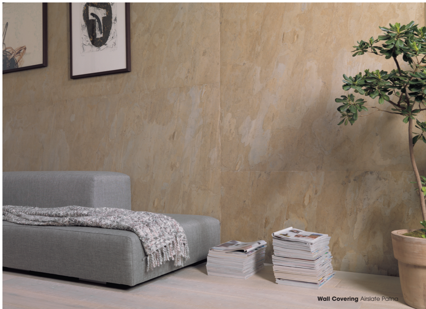
Wall Covering Airslate Patna