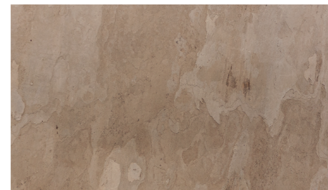
Airslate Patna 250cm x 120cm x 0,2-0,4cm 98 7/16" x 47 1/4" x 3/32"-5/32" 100242714 G-238