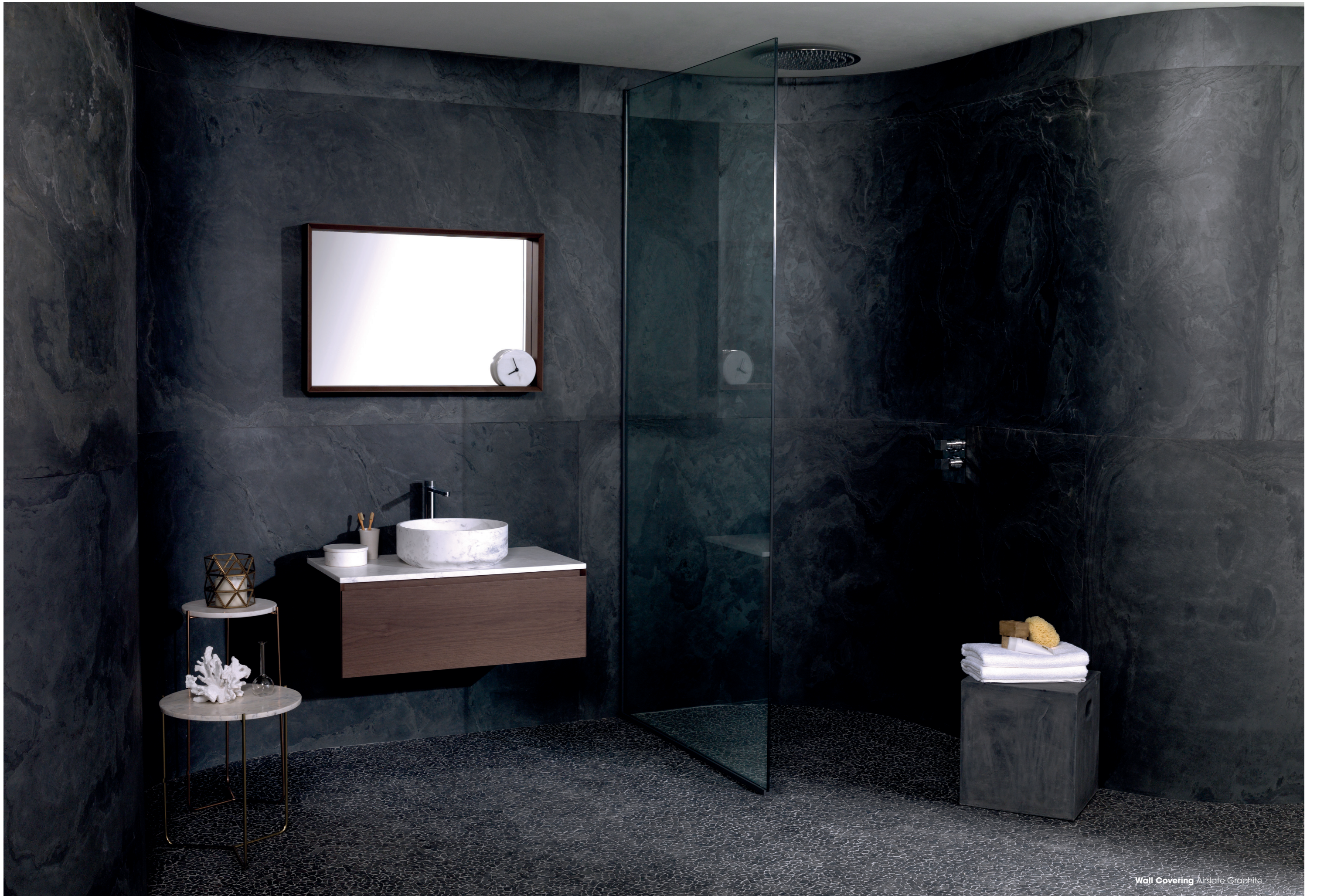
Wall Covering Airstate Graphite