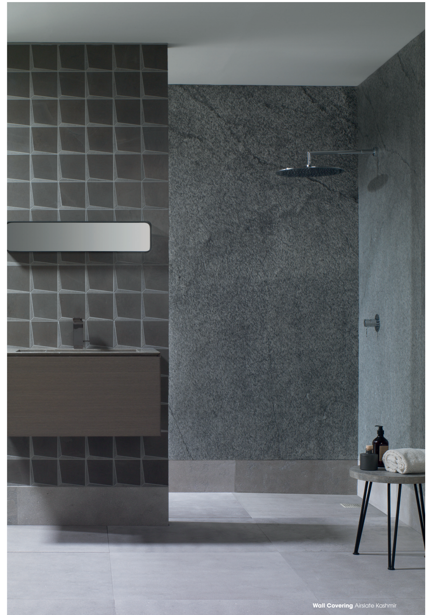
Wall Covering Airslate Kashmir

L'Antic Colonial continue à travailler sur la pierre naturelle. Il s'agit ici de l'ardoise. Cette fois-ci, elle est fabriquée en un seul format, exclusif et innovant au sein du catalogue, car elle est travaillée en fines lames. Ce matériau est constitué de quatre couches différentes, dont une en fibre de verre qui renforce la structure du produit et lui donne de la flexibilité.