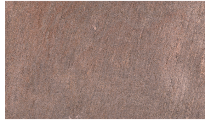
Airslate Bombay 250cm x 120cm x 0,2-0,4cm 98 7/16" x 47 1/4" x 3/32"-5/32" 100242667 G-238

Les éléments naturels sont à l'origine de pièces uniques. La collection AIRSLATE rend hommage à l'ardoise en créant une sélection de produits flexibles qui s'adaptent à tout type de revêtements muraux. Airslate, c'est une sélection de 8 pièces uniques, où l'ardoise se distingue en plusieurs coloris et textures pour représenter un environnement harmonieux et naturel.