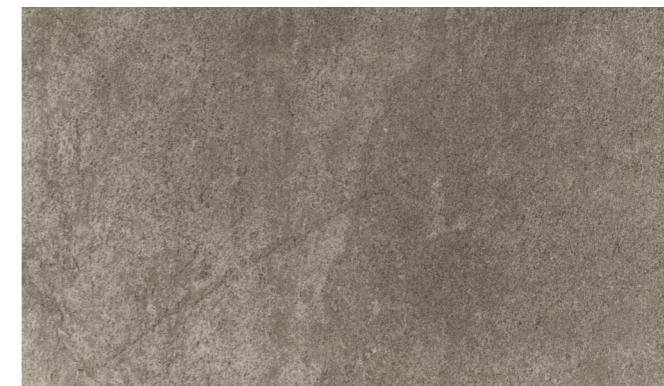
Airslate Metal 250cm x 120cm x 0,2-0,4cm 98 7/16" x 47 1/4" x 3/32"-5/32" 100242668 G-238