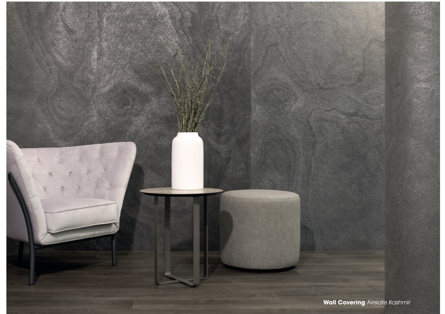
Wall Covering Airslate Kashmir

Ce produit est extrêmement polyvalent grâce aux différentes propriétés qui le caractérisent. Dans ce cas, l'ardoise est disponible en plusieurs coloris qui vont des tons les plus foncés et sobres à d'autres plus clairs et chauds. L'ensemble constitue les 8 références de la collection. En outre, Airslate peut être utilisé pour habiller des espaces ou des surfaces en tout genre, telles que lavabos, colonnes ou murs, car c'est un matériau qui convient aussi bien aux zones intérieures qu'aux zones extérieures.