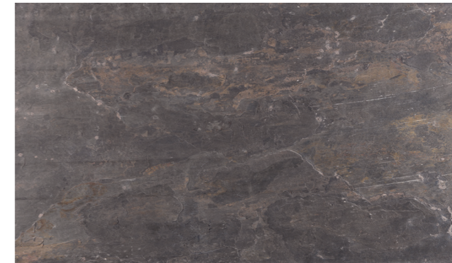
Airslate Forest 250cm x 120cm x 0,2-0,4cm 98 7/16" x 47 1/4" x 3/32"-5/32" 100242703 G-238