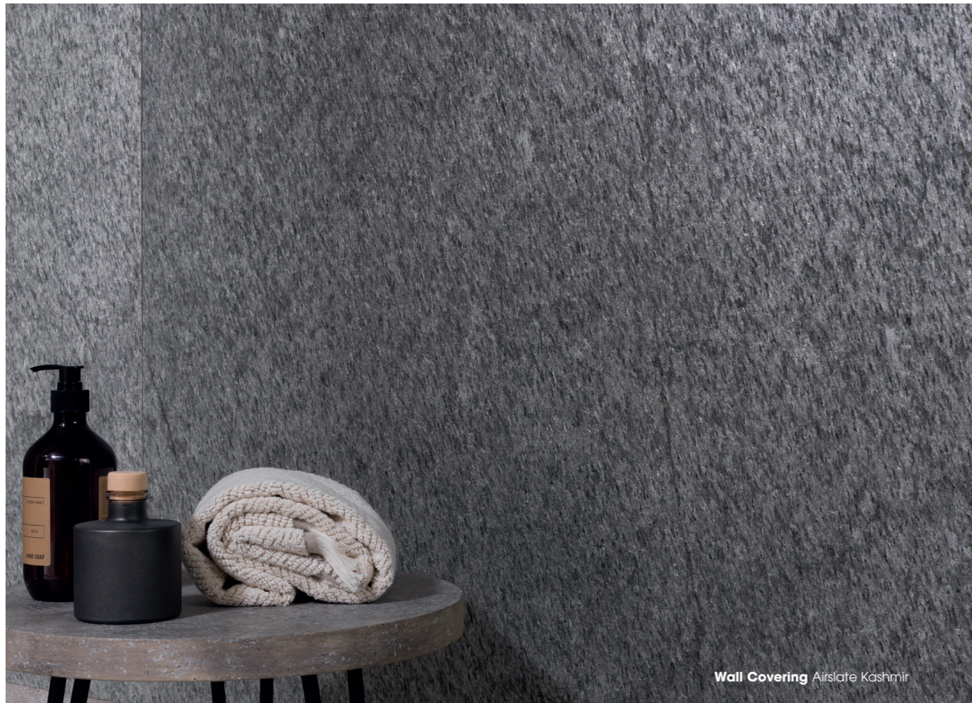
Wall Covering Airslate Kashmir