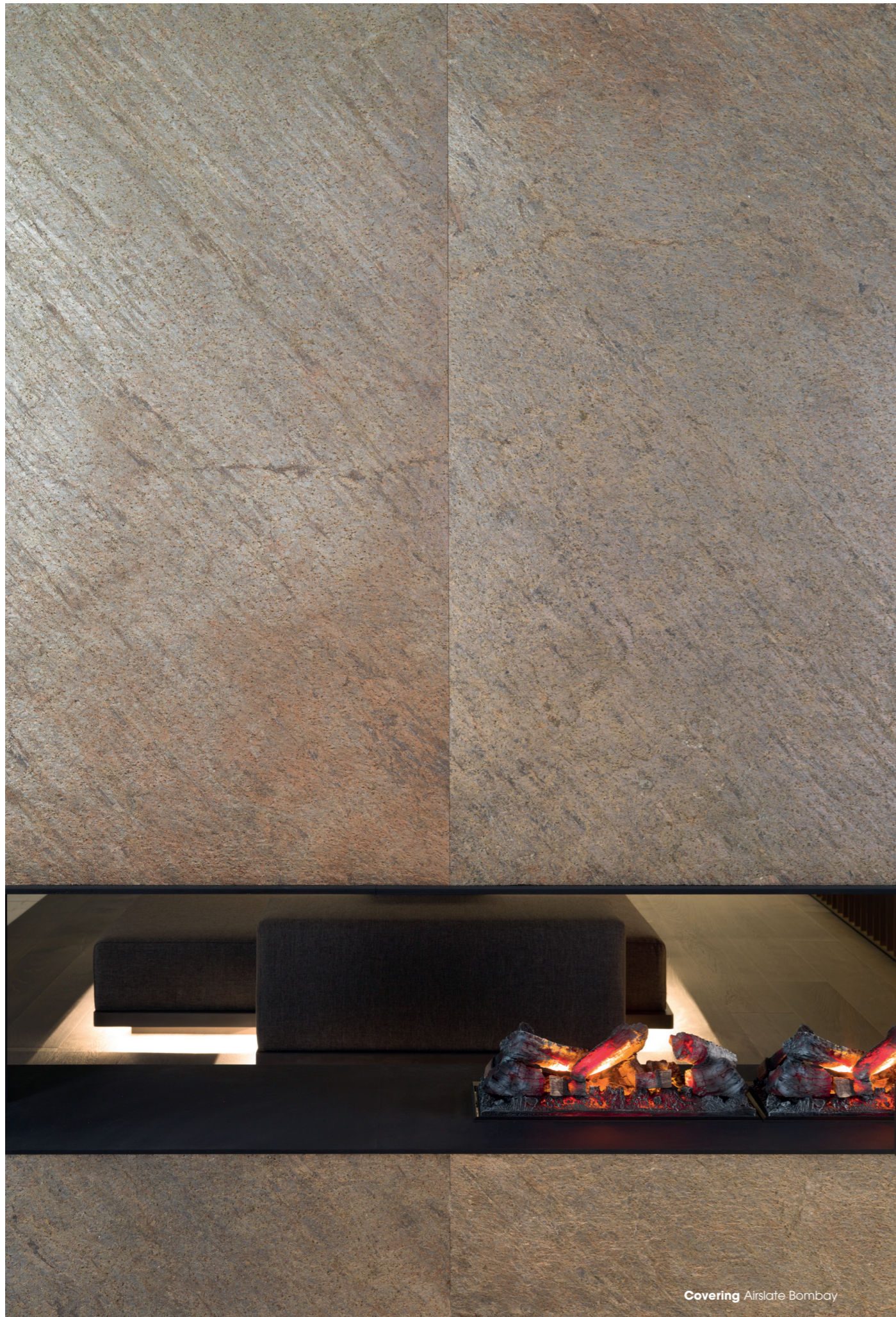
Covering Airlate Bombay