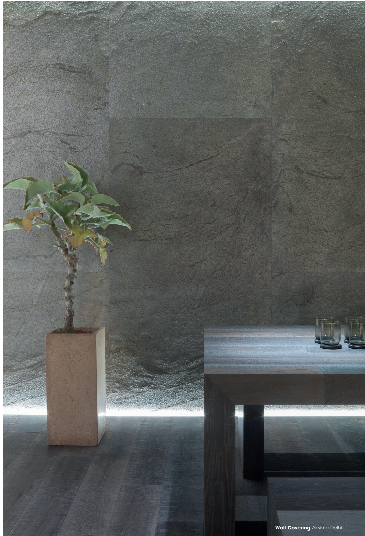
Wall Covering Airslate Delhi