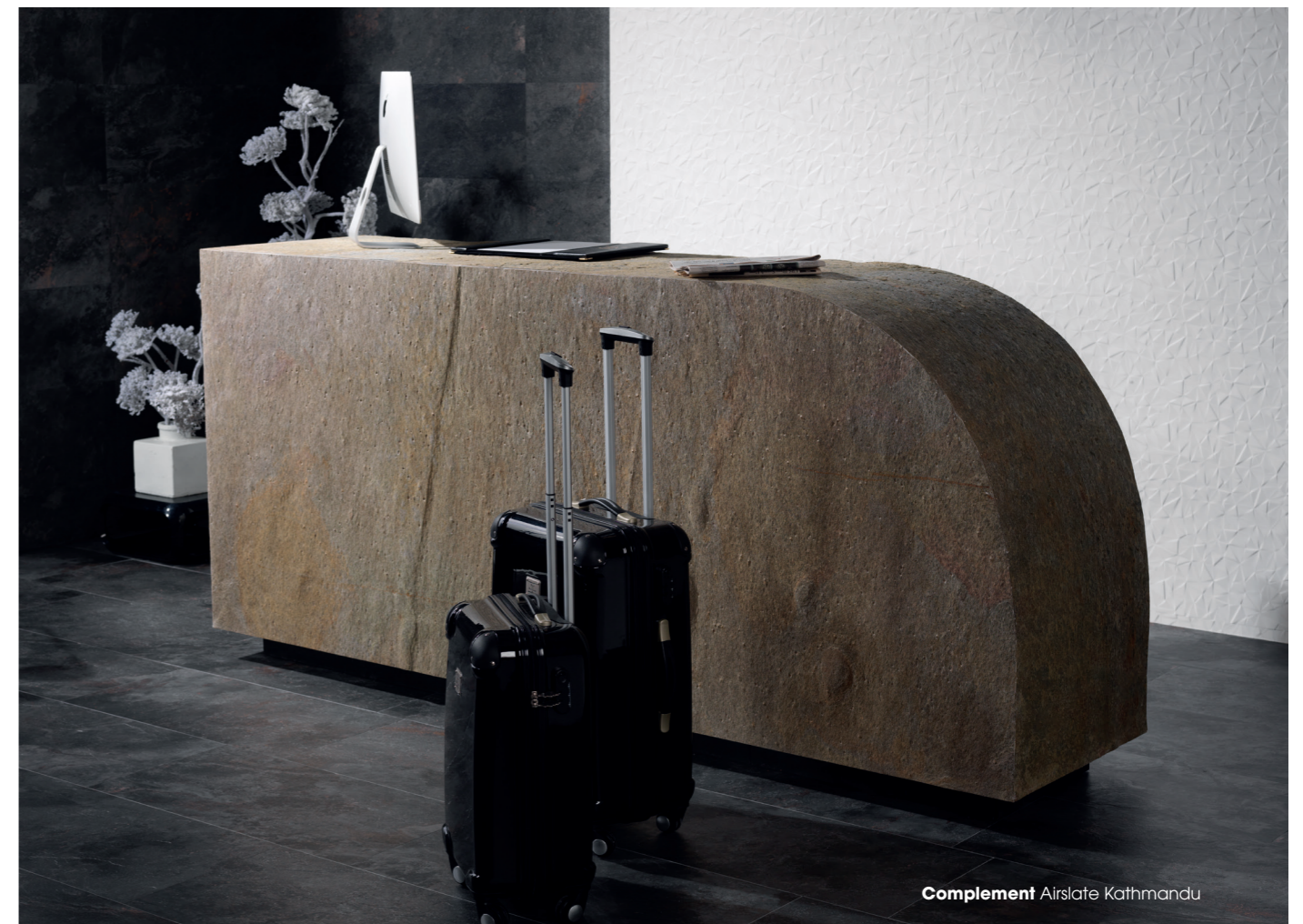
Complement Airslate Kathmandu