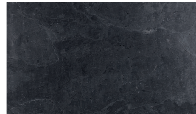
Airslate Graphite 250cm x 120cm x 0,2-0,4cm 98 7/16" x 47 1/4" x 3/32"-5/32" 100242730 G-238