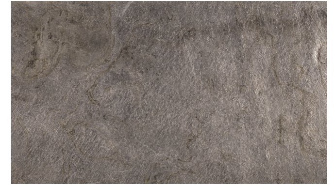
Airslate Delhi 250cm x 120cm x 0,2-0,4cm 98 7/16" x 47 1/4" x 3/32"-5/32" 100242689 G-238