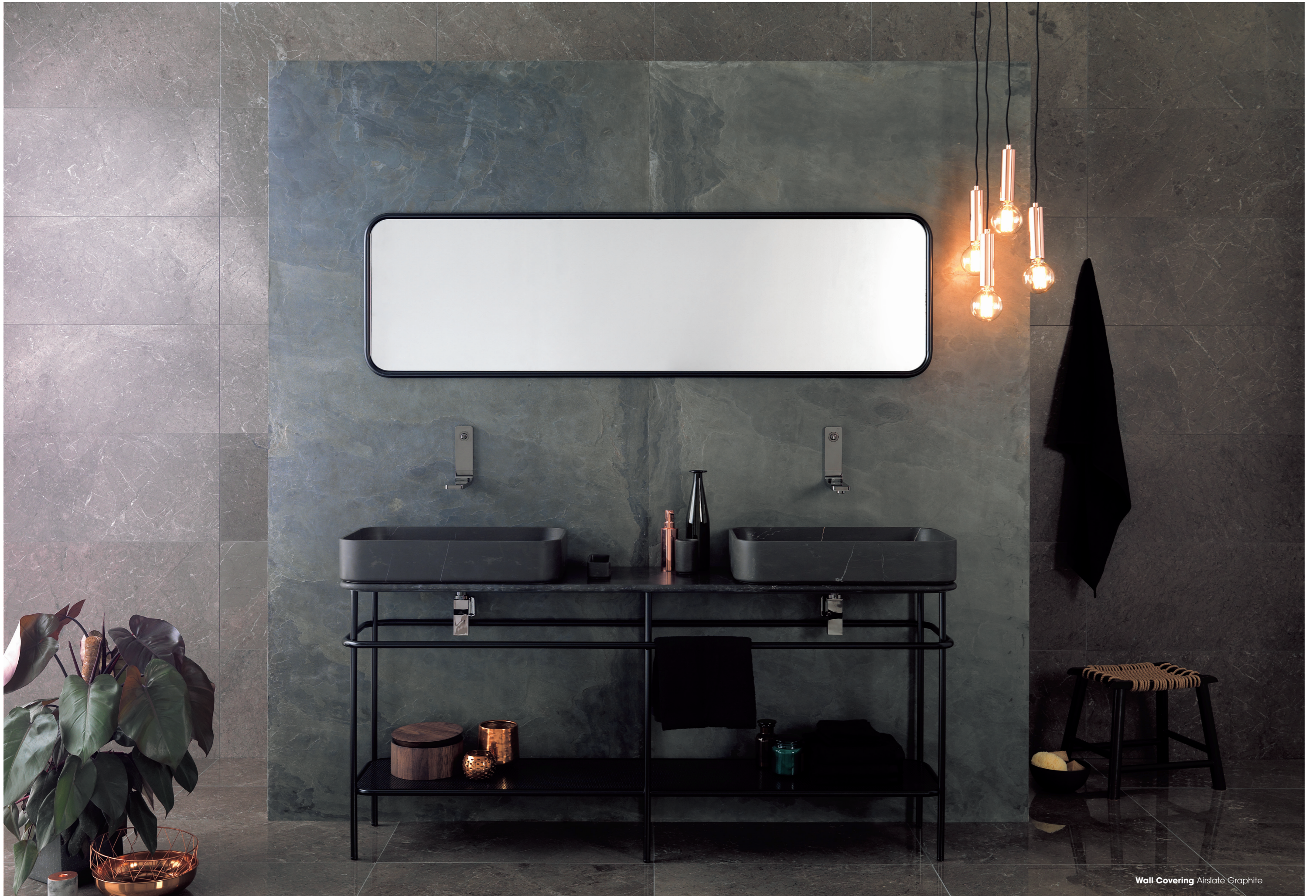
Wall Covering Airslate Graphite